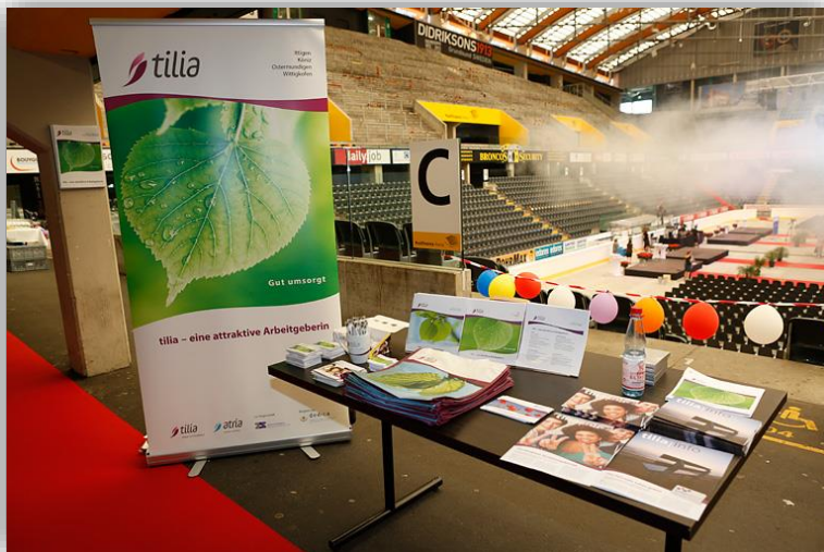
Beispiel Sponsoren-Stand mit Tisch à 1.20m Breite beim Eingang zur PostFinance Arena