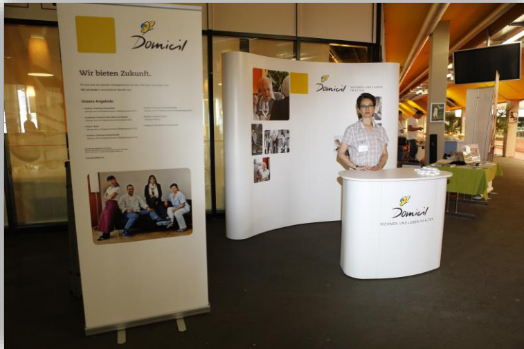
Beispiel Sponsoren-Stand beim Eingang zur PostFinance Arena